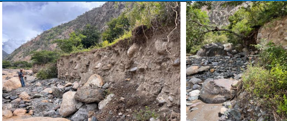
FIGURA N°01: RECORRIDO E IDENTIFICACION DE TRAMOS CRÍTICOS DESDE EL PUNTO DE INICIO, DONDE SE PUEDE VISUALIZAR QUE LA QUEBRADA EN SU MARGEN DERECHA E IZQUIERDA AFECTADO A CULTIVOS, EROSIONANDO TERRENOS EN MAXIMAS AVENIDAS.