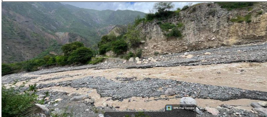
FIGURA N°02: EN EL RECORRIDO SE OBSERVA QUE LA QUEBRADA, EN SU MARGEN DERECHA E IZQUIERDA VIENE AFECTADO CULTIVOS AGRICOLAS.