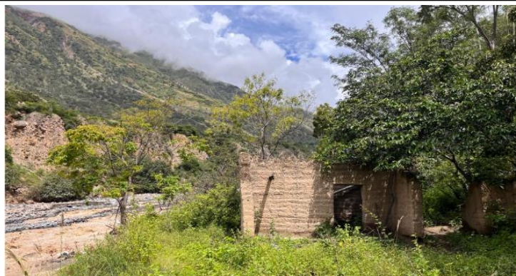
FIGURA N°03: EN EL FINAL DEL TRAMO DE LA QUEBRADA HA AFECTADO VIVIENDAS